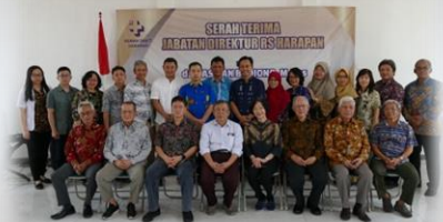
Foto bersama Jajaran direksi dan Dokter